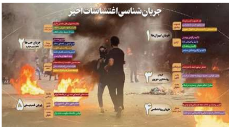
شکل ۲: جریان شناسی اغتشاشات اخیر