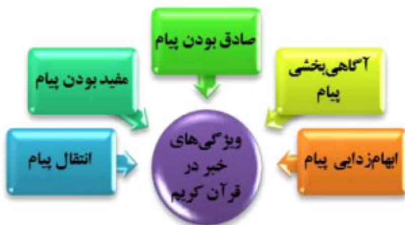
شکل ۱: ویژگی‌های پیام خبری (نبأ) در قرآن کریم

بر اساس آیه‌های قرآن کریم تعدادی از مفاهیم و واژگان، جنبه انتقال پیام دارند، اما فاقد سایر ویژگی‌های خبر حقیقی‌اند. واژگان و مفاهیمی مانند: کذب، تکذیب حق، وسوسه و وعده دروغ، شایعه‌سازی، قسم دروغ، سخن ناآگاهانه و ظنی، افتراء، افک، بهتان، تحریف، تمسخر و استهزاء، اهانت و کتمان حقیقت، گرچه نوعی خبر به حساب می‌آیند، اما چون گویای حقیقت نیستند و از واقعیت حکایت نمی‌کنند، با مفهوم اخبار جعلی و شاخصه‌های آن انطباق پیدا می‌کنند.